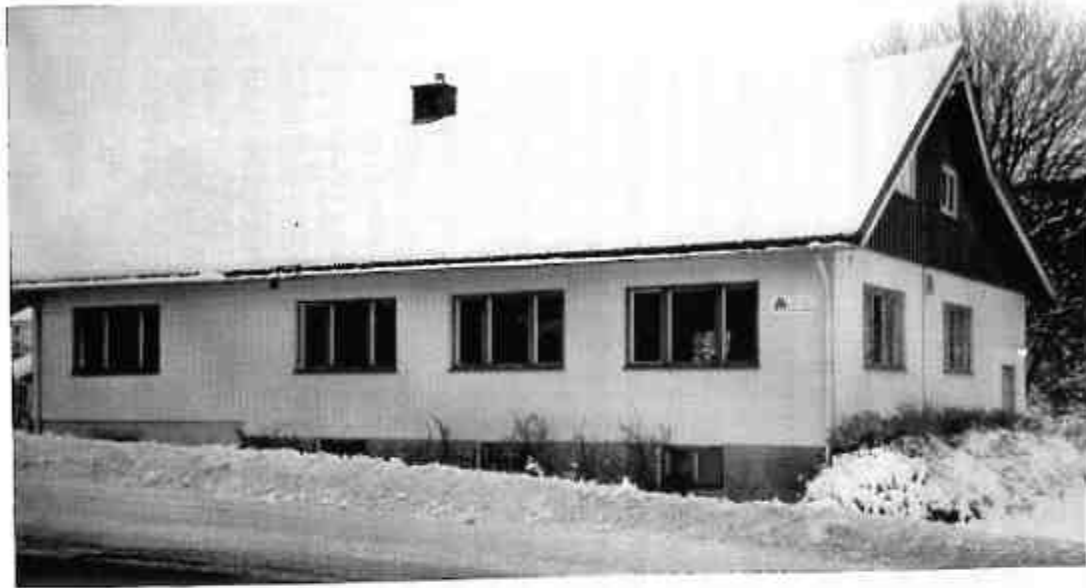
Bridgens vugge, Kløverheimen, en vinterdag.