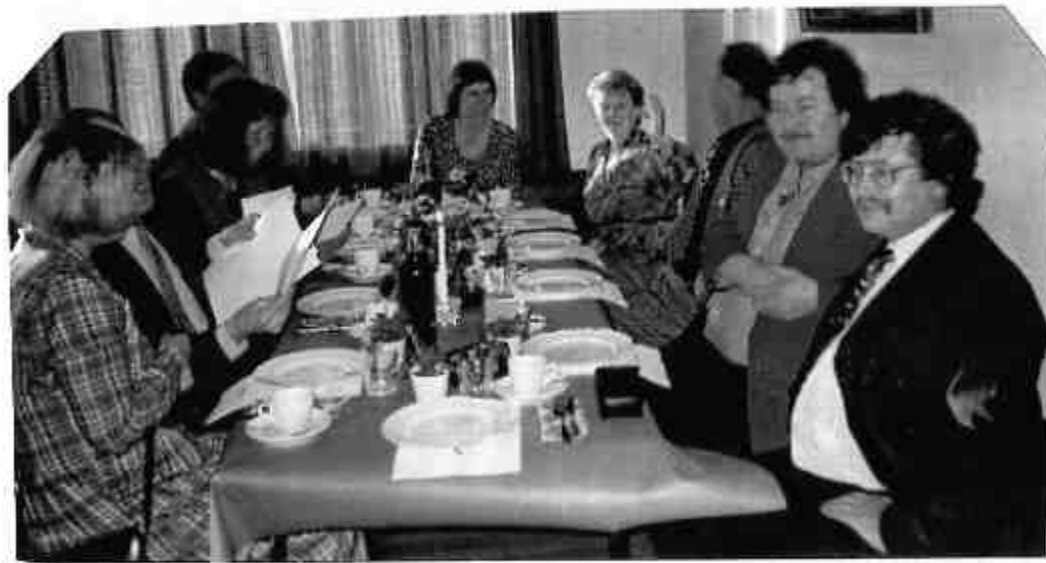
Det var alltid høy stemning under sesongavslutningene. Uten lyd yter ikke bildet stemingen full rettferdighet.