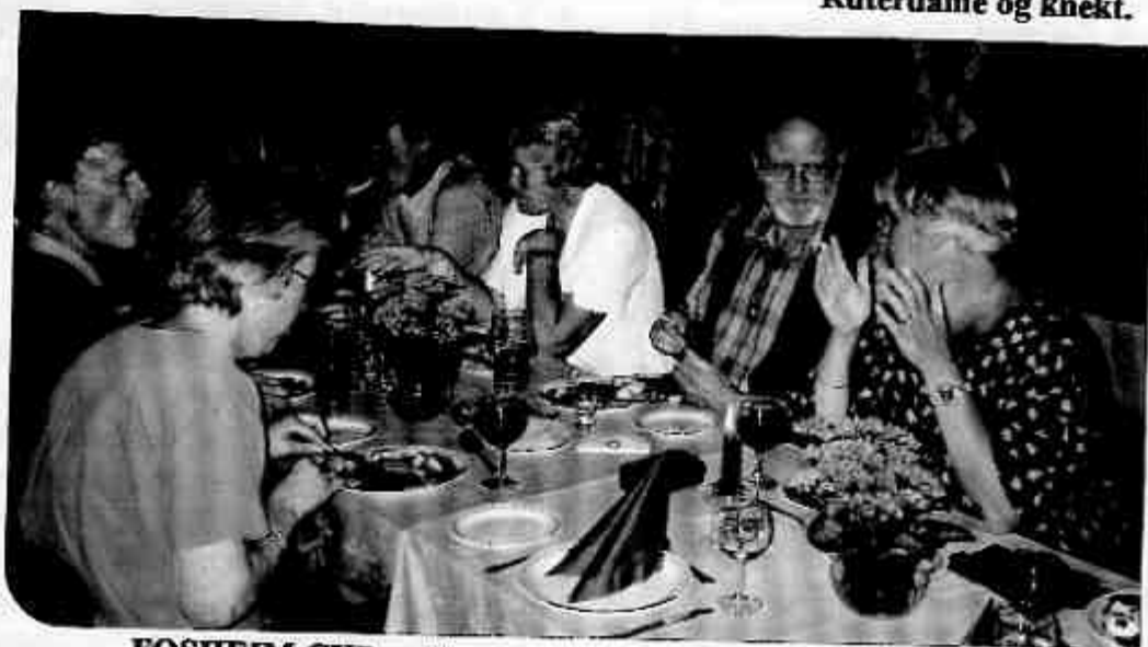
FOSHEIM CUP er like mye en sosial begivenhet hvor folk utenfor det etablerte bridgemiljøet også skal trives