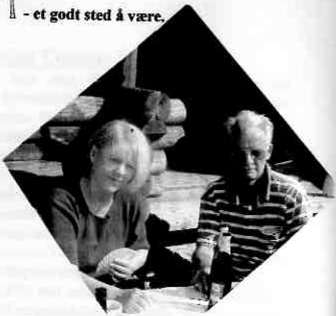
Ruterdame og knekt.