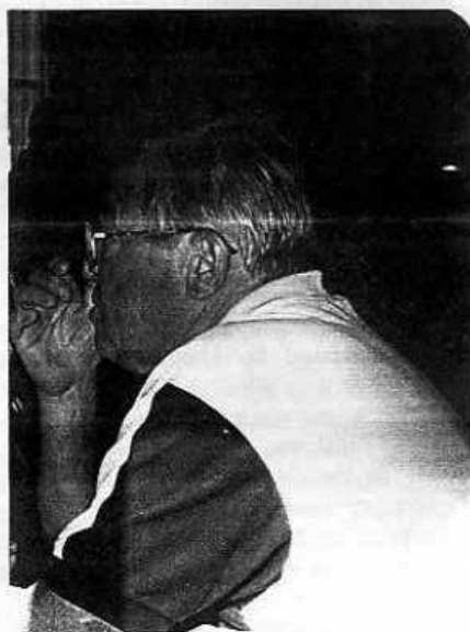
64-årsutgaven i profil.