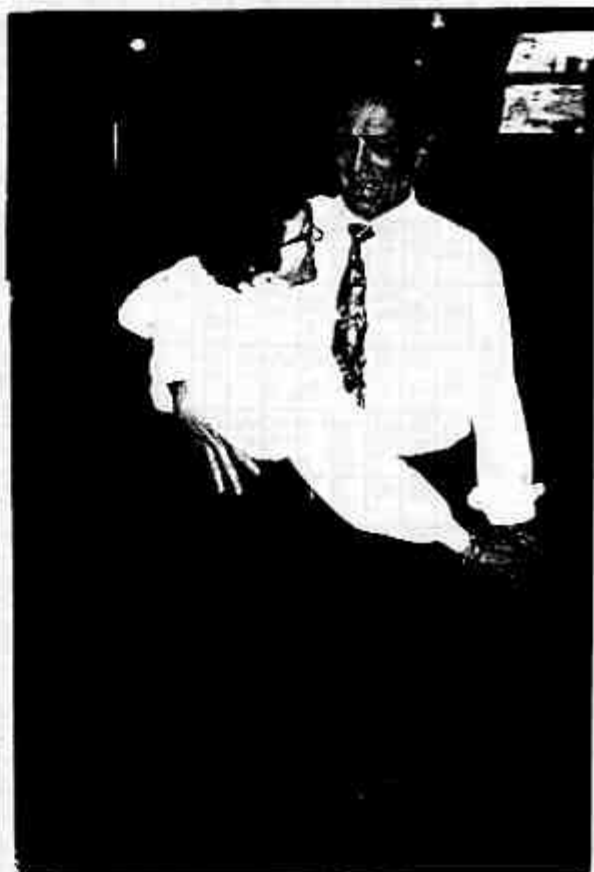
Elegant dansk-norsk dansetrupp

Når livet tidligere ikke har vært bare en dans på roser, så får man nyte dansen når den er der og heller beundre blomstene i gartneriet som en verdig kompensasjon. Dette synliggjøres også gjennom hans livsmott: "Lev livet mens du har det!"