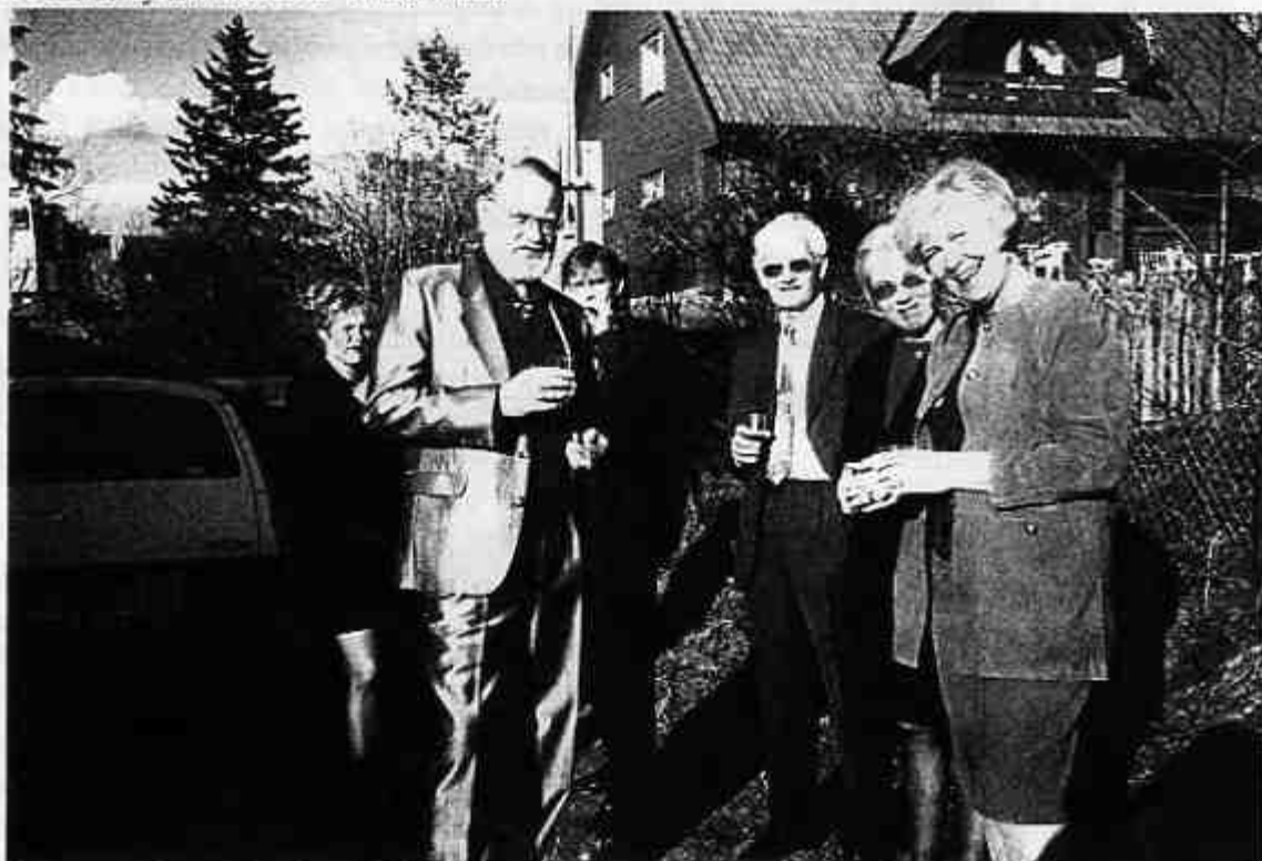
Et overordnet prinsipp i Klover Ess er at folk trives og har det hyggelig sammen med familie og venner også utenom kortbordet. Her ser vi noen feststemte deltakere for Årsfesten 1999.