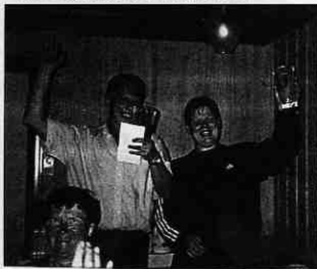
2 generasjoner Seierstener (far til venstre?)

Etterpå ble det premieutdeling både til bridgefolket og de som hadde kravlet seg igjennom naturstien. Når to blad Seiersten slår seg sammen bør det jo bli seier og det skjedde da også. Fjorårsvinnerne, familien Bentestuen, måtte i år gi tapt for familien Seiersten. Far og sønn ble for sterke for alle sammen og overtok dermed krystallpokalene på lån i ett år og fikk sine navn inngravert etter årstallet 1999.