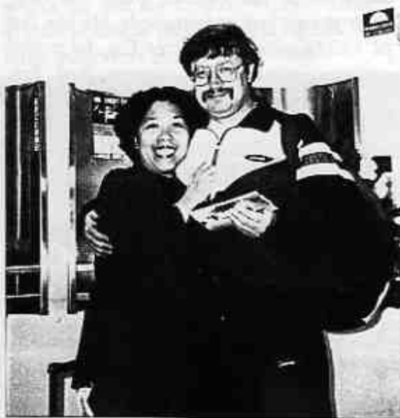
Farmasøyten og telegrafisten.