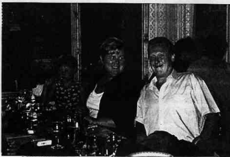
Mette i midten, den eneste uten premie i Seierstenfamilien, ser likevel fornøyd ut.