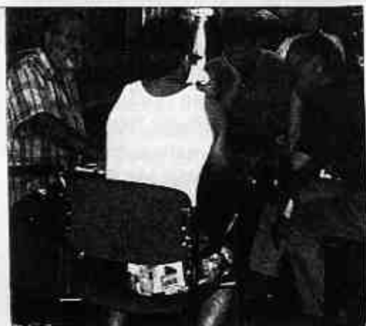
Vi spilte faktisk også litt bridge.