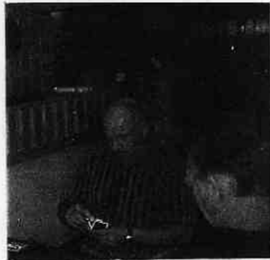
En konsentrert jubilant, her knipset under Fosheimturneringen for to år siden.