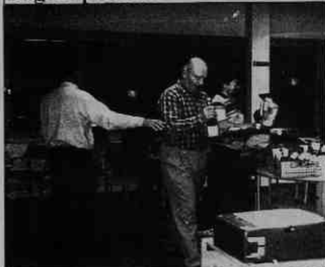
Kungliga himself, 60 er et sterkt tall. Se side 3

Storefjellturneringen , 1001 moh i pinsen har blitt en hyggelig tradisjon for mange. Kløver Ess var som vanlig sterkt representert, også redaktøren klarte å få seg fri fra jobben, les om dramaet mm før dette ble avklart. side 10