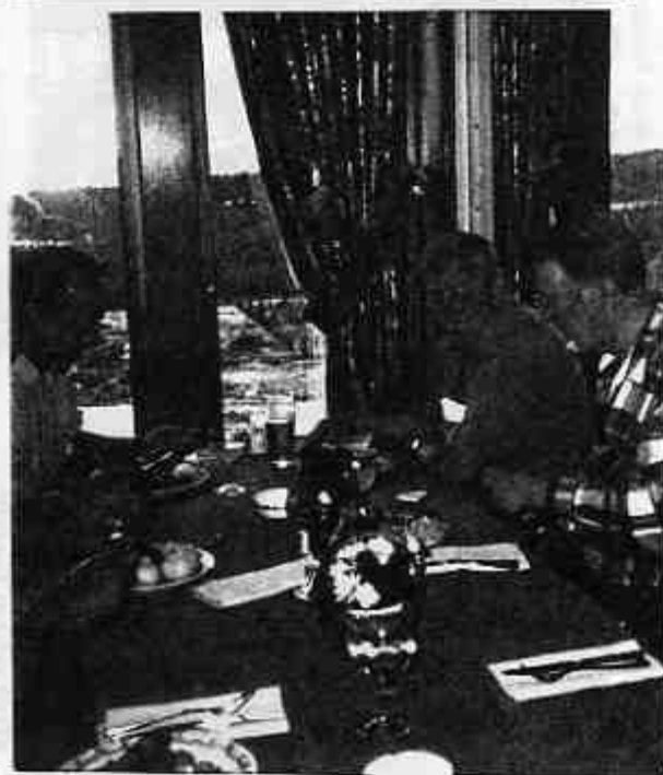
Stemningsbilder fra Storefjell.